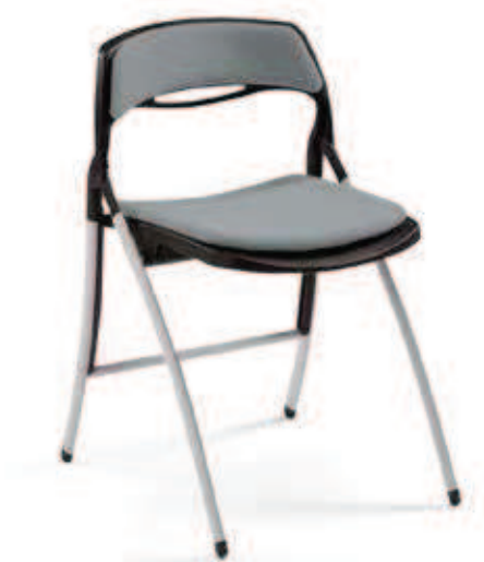
ARKUA 700 FOR UPHOLSTERY